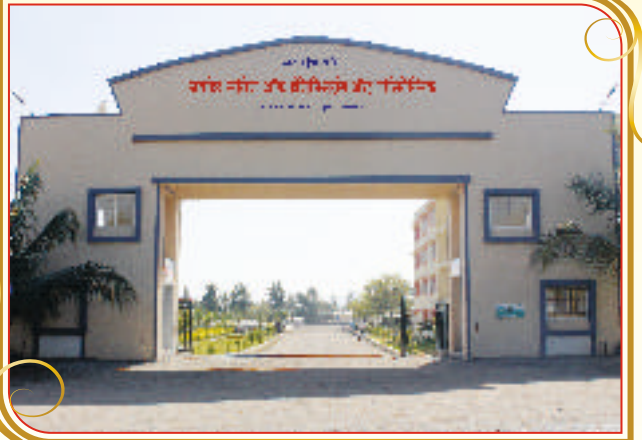
जयहिंद शैक्षणिक संकुल मुख्य प्रवेशद्वार