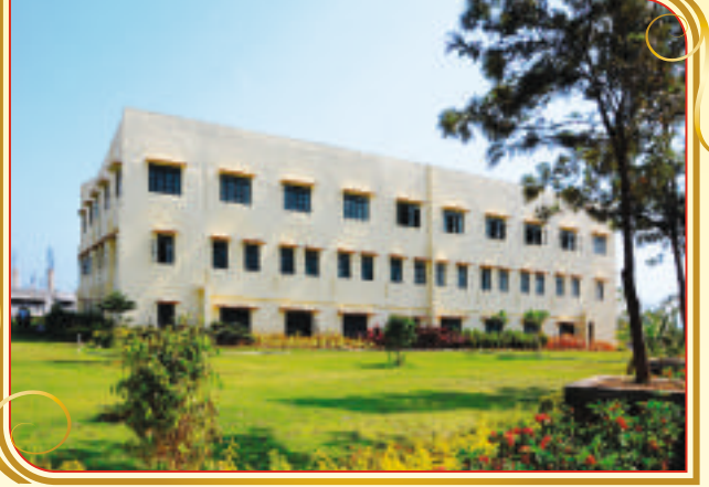
जयहिंद संकुलाचे सुसज्ज कॅम्पस (२००८)