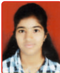
Karande Nita SE Auto