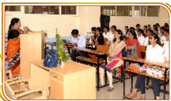
निर्भय कन्या अभियान