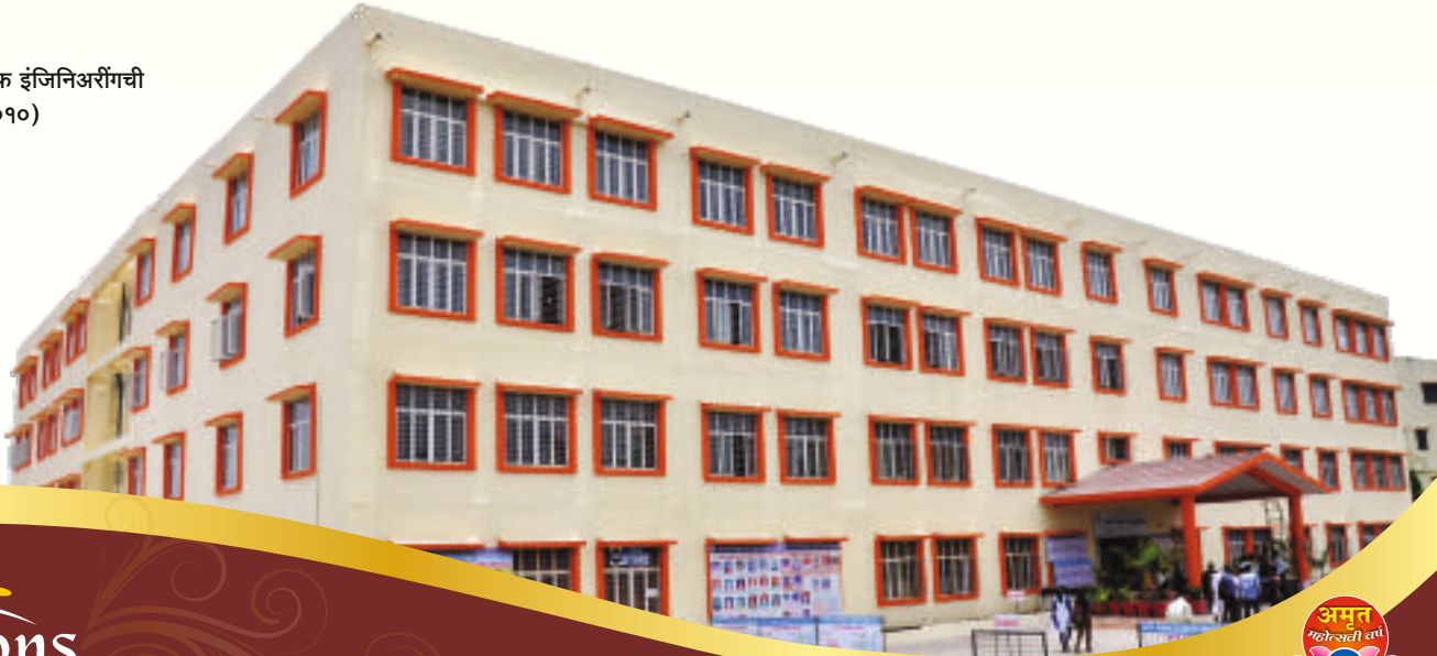
जयहिंद कॉलेज ऑफ इंजिनिअरींगची सुसज्ज इमारत (२०१०)