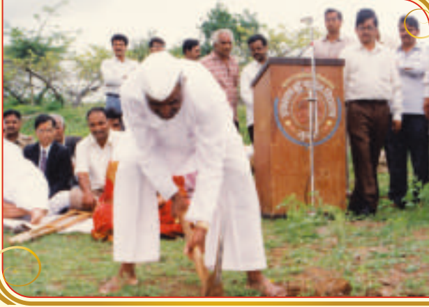
कुरणच्या माळरानावर जयहिंद शैक्षणिक संकुलाचे भुमिपुजन (२००९)