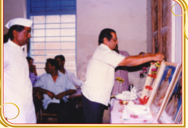
२ ऑक्टोबर १९९७ रोजी तांत्रिक शिक्षणाची मुहूर्तमेढ