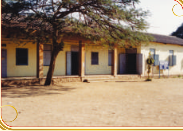
शंकरराव बुट्टे पाटील विद्यालयात सन १९९७ साली जयहिंद पॉलिटेक्निकची सुरुवात