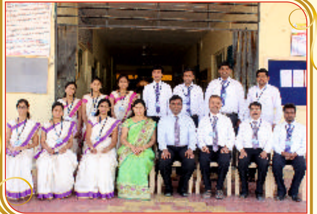
Department of Computer Engineering