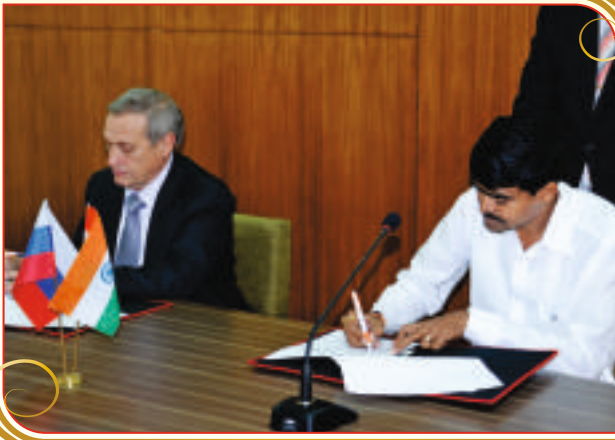
सारातोव्ह स्टेट टेक्निकल युनिव्हर्सिटी, रशिया बरोबर शैक्षणिक सामंजस्य करार (२०१२)