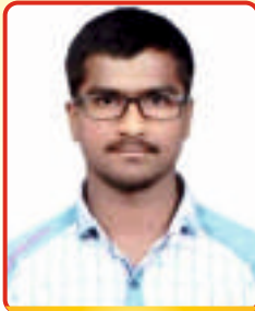
Dumbre Sagar BE Civil