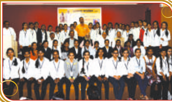
विद्यार्थीनी शिष्यवृत्ती प्रदान कार्यक्रम