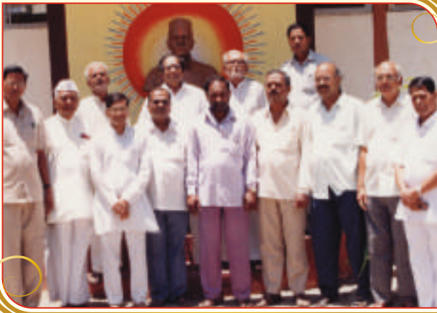
जुन्नर एज्युकेशन सोसायटीच्या संचालक मंडळाचे मोलाचे सहकार्य