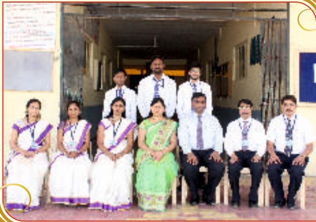
Department of Civil Engineering