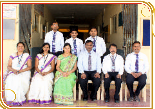
Department of FE Engineering