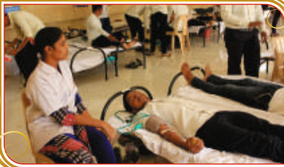
स्वातंत्र्य दिन समारंभानिमित्त रक्तदान शिबीर