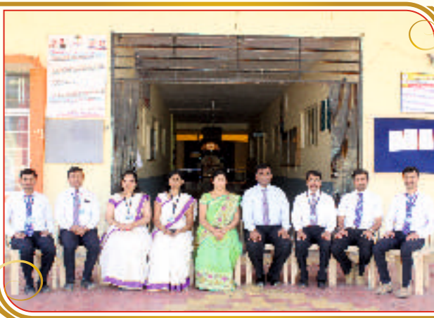
Department of E & TC Engineering