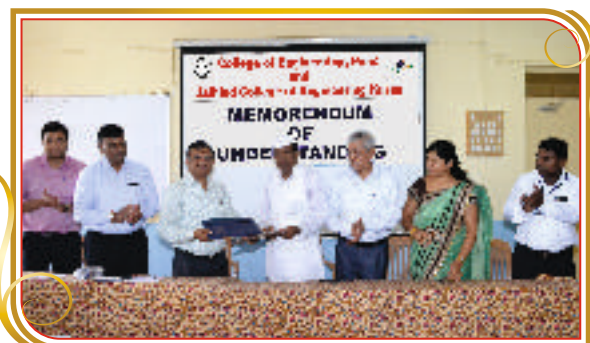
सी.ओ.ई.पी. पुणे यांच्या समवेत सामंजस्य करार