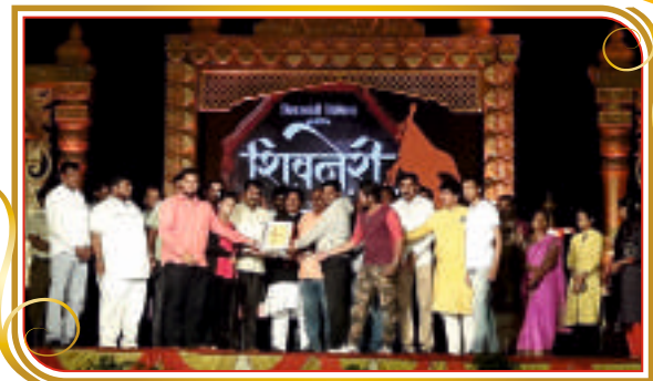
शिवजयंती महोत्सव २०१८