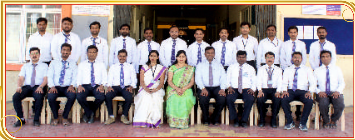
Department of Mechanical and Automobile Engineering