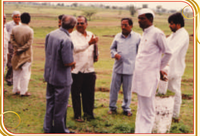
ए. आय. सी. टी. ई. (नवी दिल्ली) तज्ञांची भेट (१९९७)