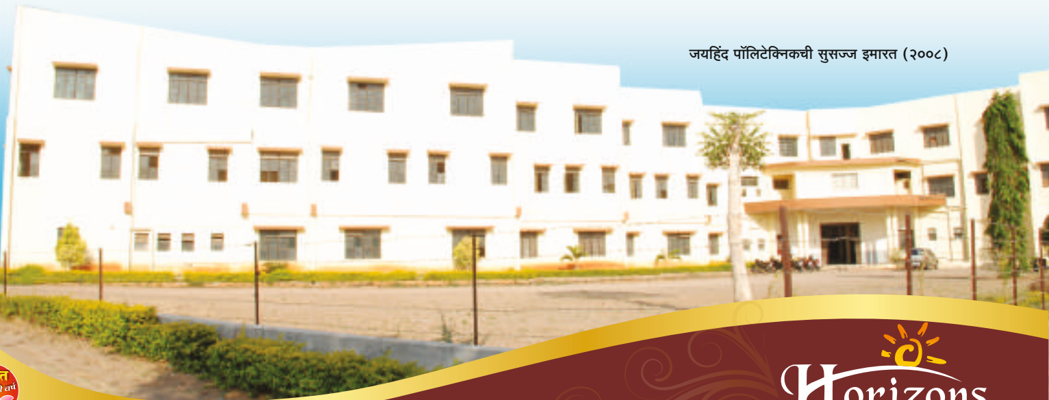
जयहिंद पॉलिटेक्निकची सुसज्ज इमारत (२००८)