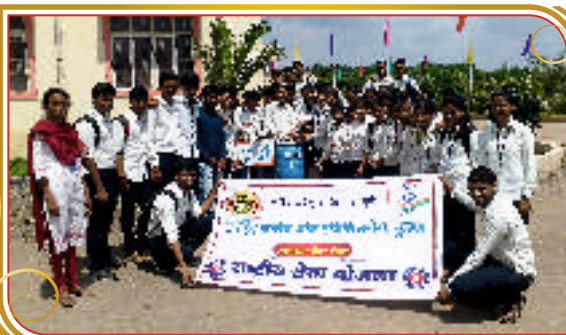
स्वच्छता हिच सेवा