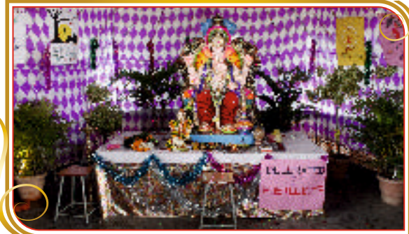
गणेश उत्सव सोहळा