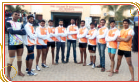
जिल्हा स्तरीय कबड्डी संघ