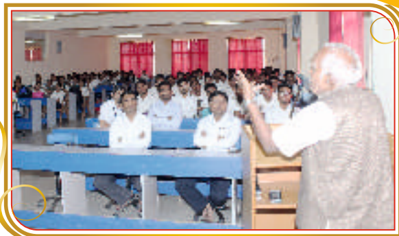
व्यवसाय मार्गदर्शन शिबीर