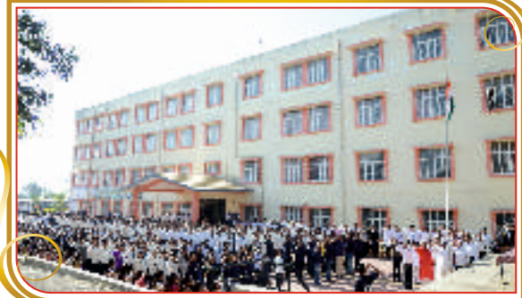
२६ जानेवारी २०१८