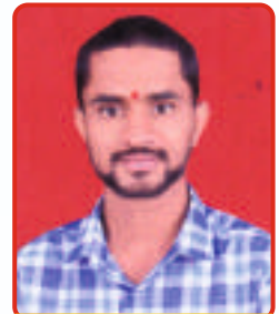
Shewale Akash Auto TE